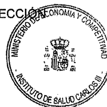
Fdo.: Sonsoles Berron Morato

LA PRESIDENTA DE LA COMISION DE DE SELECCIÓN