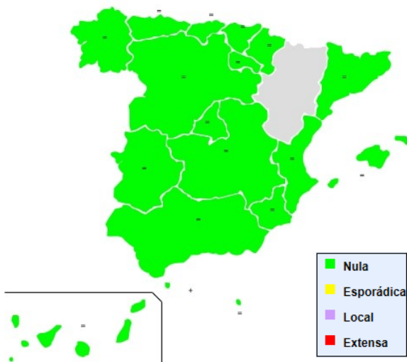
Figura 2. Nivel de intensidad de la gripe. Semana 41/2019. Temporada 2019-20. España