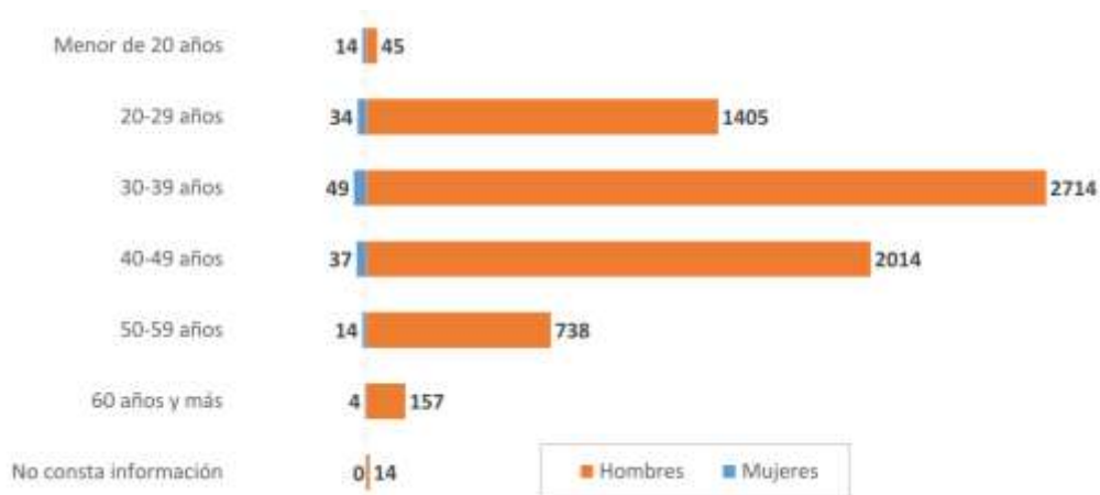
Figura 1. Nº de casos por grupos de edad y sexo

La distribución por edad y sexo se muestra en la figura 1.