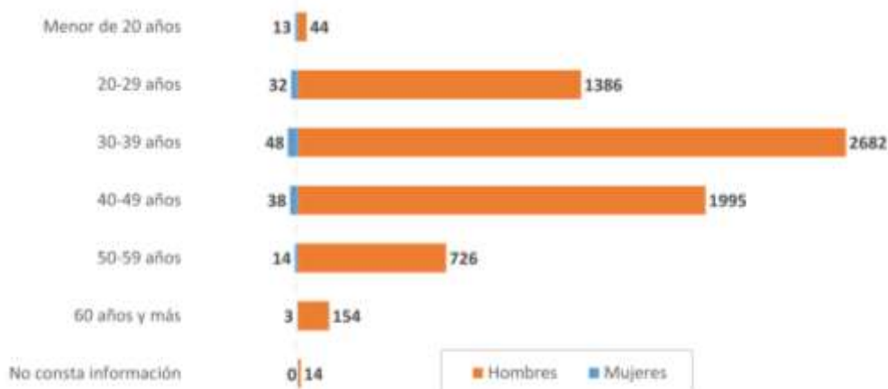
Figura 1. Nº de casos por grupos de edad y sexo

La distribución por edad y sexo se muestra en la figura 1.